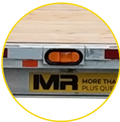
LUMIÈRE DEL J-LITE