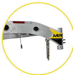
COL DE CYGNE

Certains modèles offrent la possibilité d'opter pour un col de cygne plutôt qu'un cadre en V