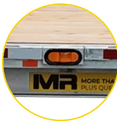
LUMIÈRE DEL J-LITE