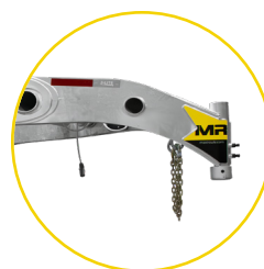
COL DE CYGNE

Certains modèles offrent la possibilité d'opter pour un col de cygne plutôt qu'un cadre en V