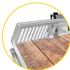
GARDE FRONTAL ROBUSTE