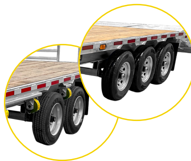
DOUBLE OU TRIPLE ESSIEUX