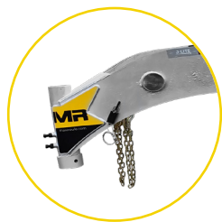
COL EN CYGNE