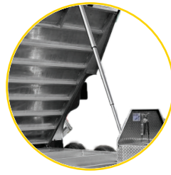
SYSTÈME DE BASCULE HYDRAULIQUE