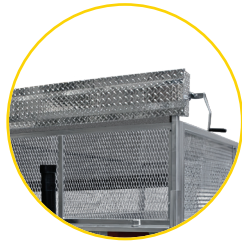
PROTECTEUR DE TOILE