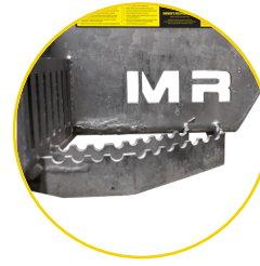
MARCHEPIED EN COIN SOLIDE