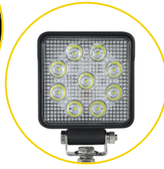
ÉCLAIRAGE DEL AVEC BRAS AJUSTABLE