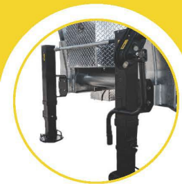
VÉRINS 25,000 LB