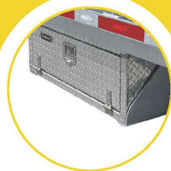
COFFRES EN ALUMINIUM