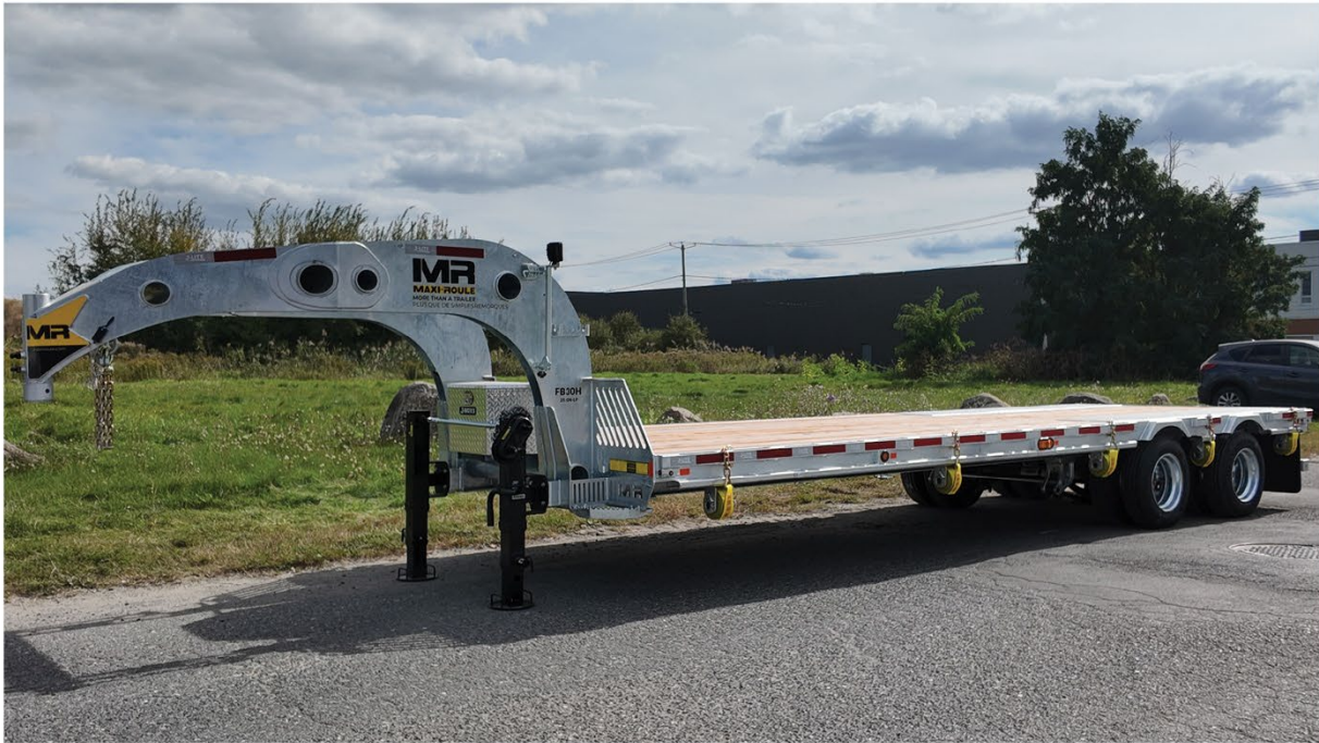
Remorque à Plateforme sans Descente " FLAT DECK "