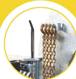
PORTE CHÂÎNES ET BARRE DE TREUIL