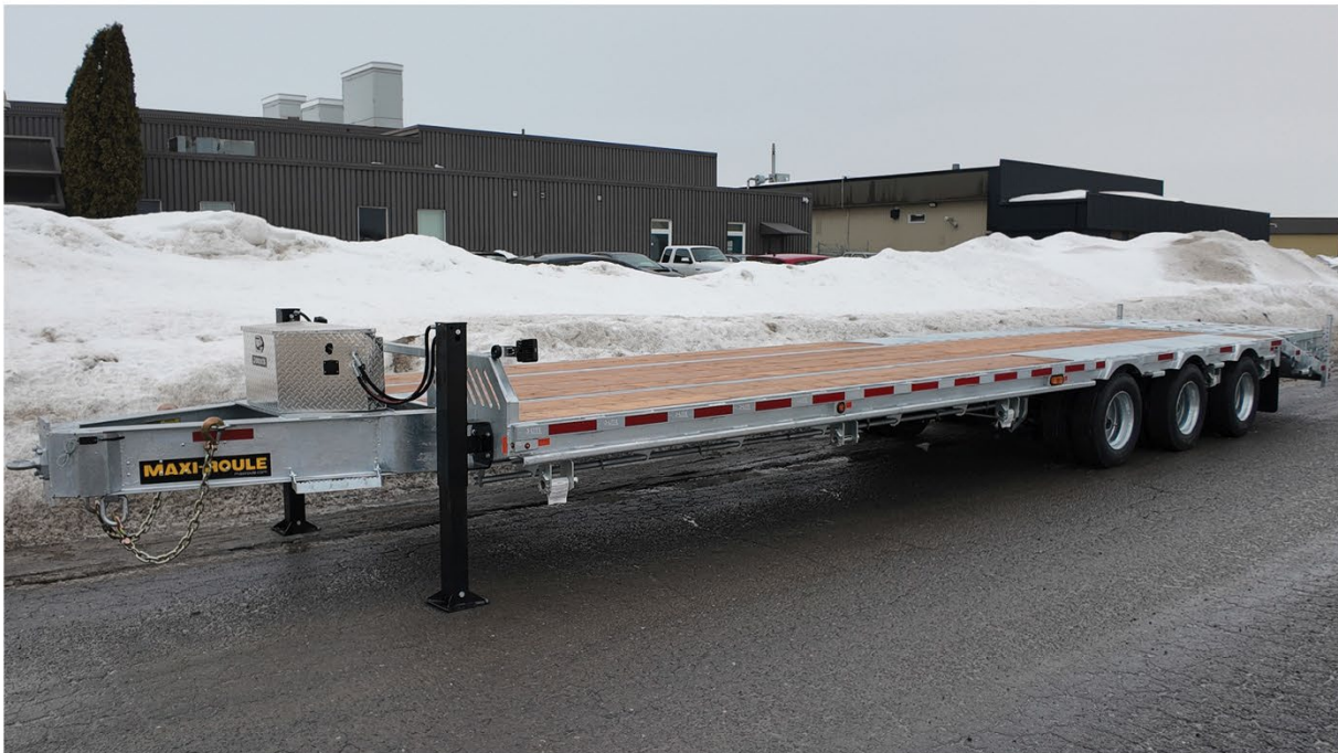
Remorque à Plateforme " TAG-A-LONG "