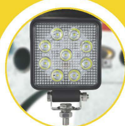
ÉCLAIRAGE DEL AVEC BRAS AJUSTABLE