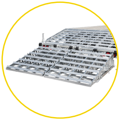
RAMPE DE 5 PIEDS