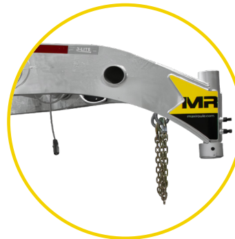
COL DE CYGNE

Certains modèles offrent la possibilité d'opter pour un col de cygne plutôt qu'un cadre en V