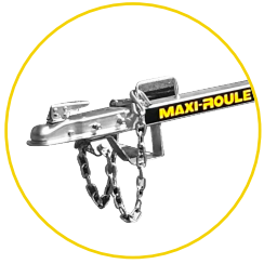
BRAS DROIT AMOVIBLE