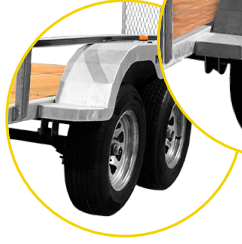
SIMPLE OU DOUBLE ESSIEUX